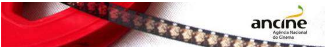
TABELA DE VALORES DA CONDECINE