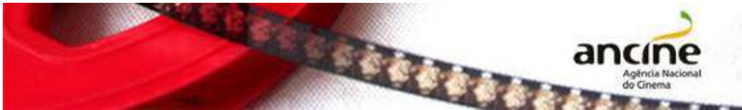
TABELA DE VALORES DA CONDECINE